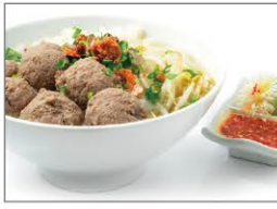
バクソは牛肉のすり身から作られた肉団子スープです。