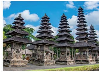
世界遺産 タマンアウン寺院