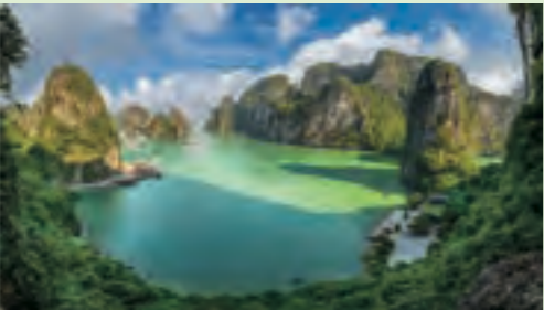
世界遺産ハロン湾