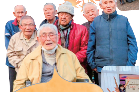
紅葉ドライブではい♪チーズ