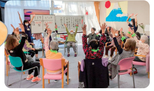
みんなで楽しく運動会!