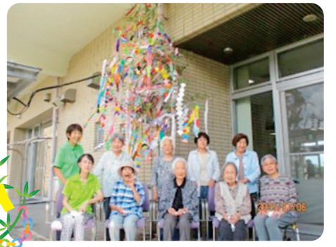
七夕飾りできたよ〜