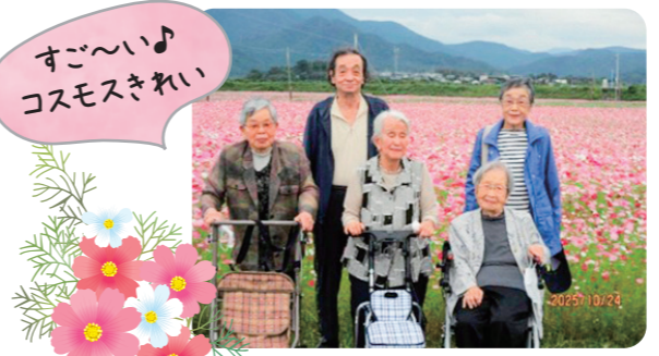
すごい♪コスモスきれい