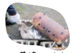
お芋焼いています