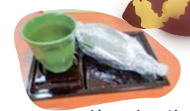
温かいお茶と焼き芋