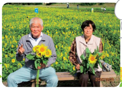
秋なのにひまわりが咲いてるよ