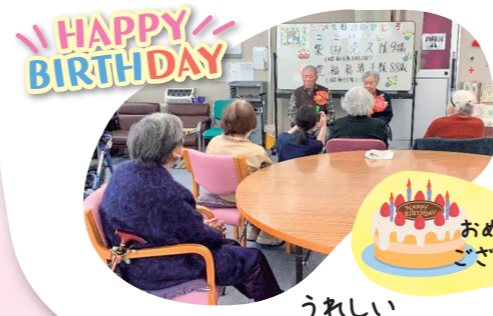
うれしい誕生日会