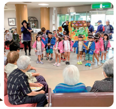
小鳩保育園の園児によるお神輿披露