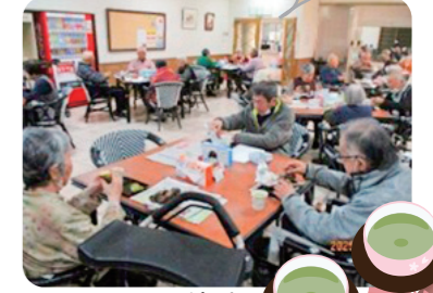
みなさんでお茶会