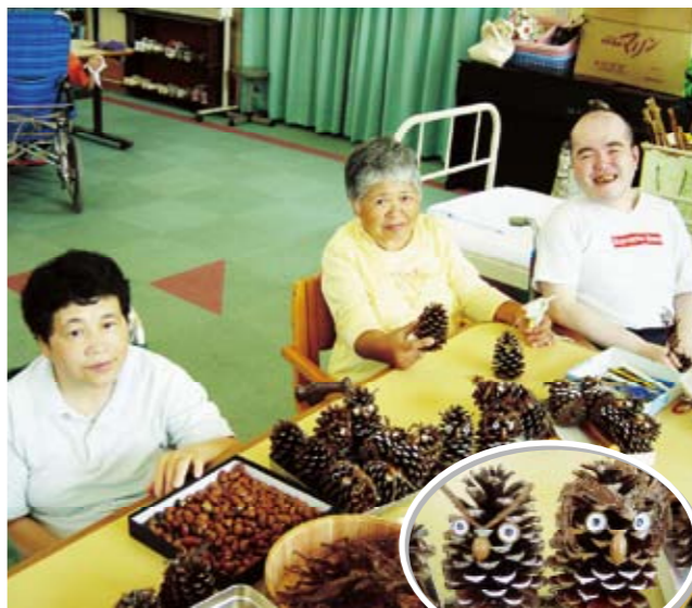
みんなで作りました!!(´▽`)/