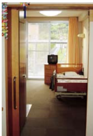
お部屋は4床あり、全室個室でトイレ付きとなっています

◎ご利用前に、お住まいの市町村への申請が必要です。詳しくは、かせだフレンドホームまでお気軽にお電話下さい。