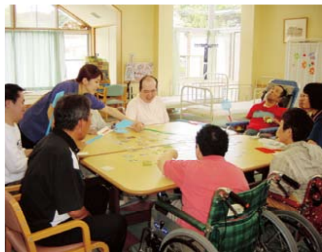
レクの一場面です。(◎◇◎)／

食事・入浴はもちろん、日替わりでのミニゲームや創作活動を行っています。食後の簡単レクリエーションでは、いつも笑いが絶えません！