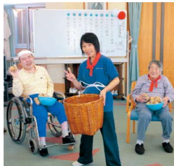
楽しい運動会でした！

★ただいま利用者大募集しています！ お気軽に見学等いらしてください。 楽しい時間を一緒に過ごしましょう。 (お問い合わせは 茶田まで)