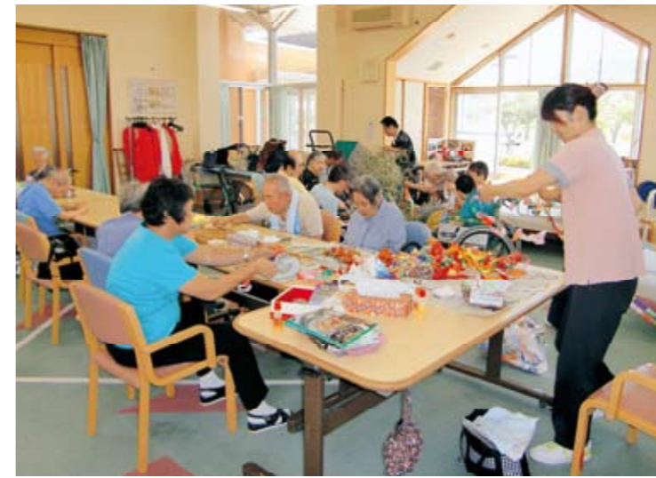
今から楽しい食事です♪

★ただいま利用者大募集しています！ お気軽に見学等いらしてください。 楽しい時間を一緒に過ごしましょう。 (お問い合わせは 茶円まで)