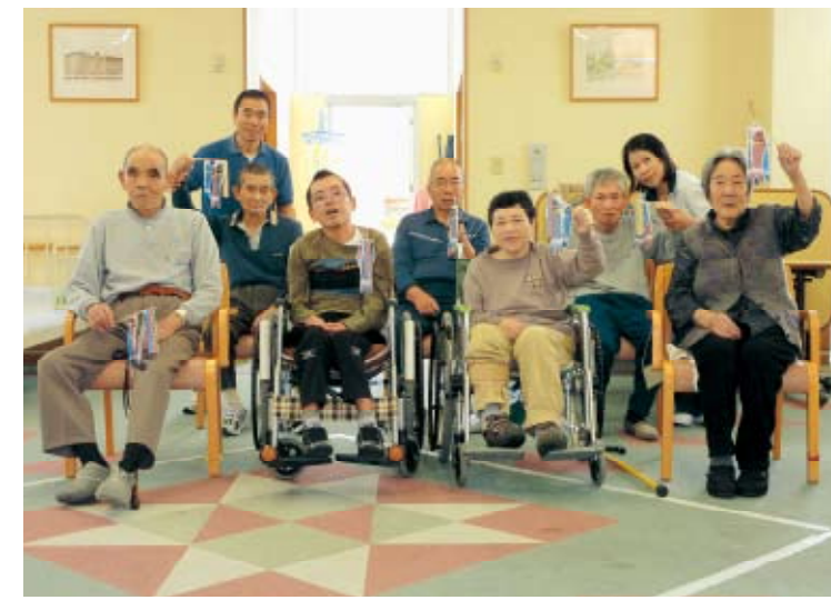
鯉のぼりを作ったよ！