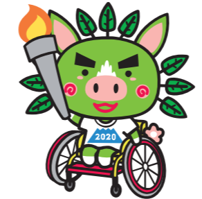
許可番号 30かごしま国体承認第1-24号

熱い鼓動 風は南から 燃ゆる感動がごしま国体 第75回国民体育大会 2020年10月3日(土)〜10月13日(火) 燃ゆる感動がごしま大会 第20回全国障害者スポーツ大会 2020年10月24日(土)〜10月26日(月)