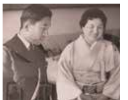
1969年 (昭和44年) 皇太子殿下真心の園を行啓