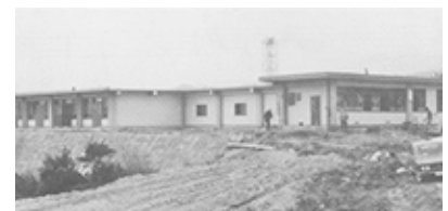
1969年 (昭和44年) 竣工