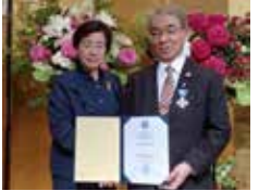
2023年 (令和5年) アルベルト・シュバイツァー章 受章