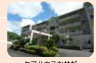
ケアハウスかせだ