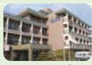
ケアハウス花みず木