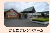
かせだフレンドホーム