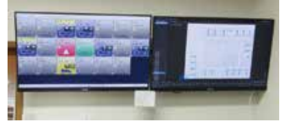
2022年 (令和4年) 法人のデジタル化始まる