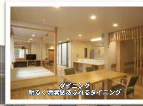
ダイニング 明るく清潔感あふれるダイニング