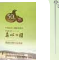
開設 50 周年記念誌