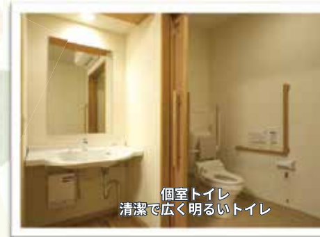
個室トイレ 清潔で広く明るいトイレ