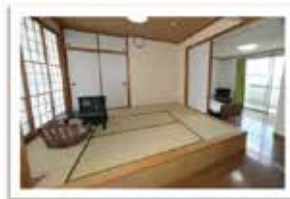
● 明るく清潔感ある居室