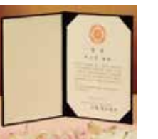
2009年 (平成21年) 高松宮妃癌研究基金学術賞 受賞