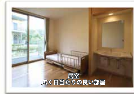
居室 広く日当たりの良い部屋